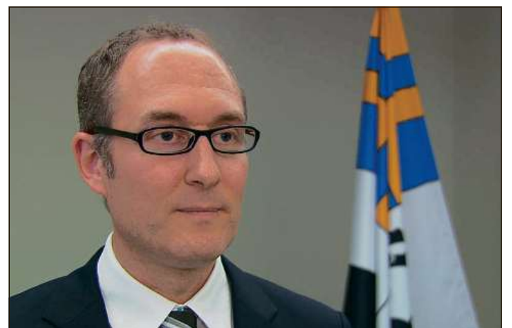
Cussegliev guvernativ Christian Rathgeb ha dà l'incumbensa a la Procura publica grischuna.